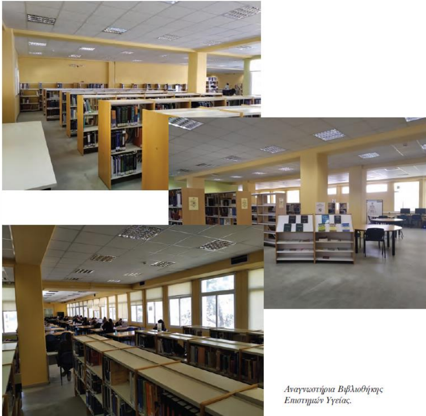
Αναγνωστήρια Βιβλιοθήκης Επιστημών Υγείας.